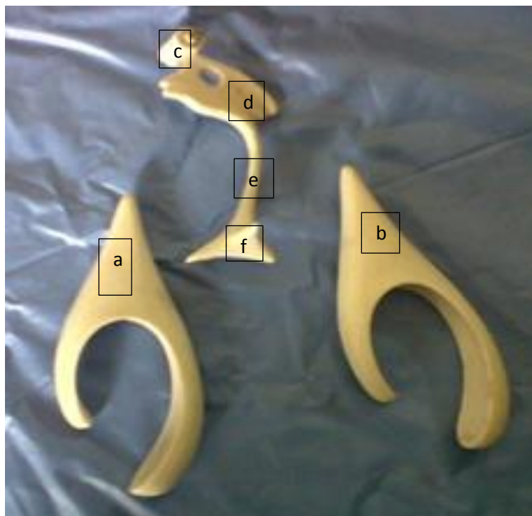
Fotografía 1. Ventrículos encefálicos. a) Ventrículo lateral izquierdo; b) ventrículo lateral derecho; c) conducto interventricular; d) tercer ventrículo; e) acueducto mesencefálico y f) cuarto ventrículo.

En el estudio adelantado por los autores Martínez et al. (2006), en el que aplicaron la técnica de inyección y de corrosión, utilizando ácido sulfúrico al 98% y encéfalos fijados previamente en formol al 5%, los modelos fueron de menor calidad, con rugosidades y arquitectura anatómica deficiente. De igual modo, no se estimó el grado de fidelidad final con respecto a la pieza o molde patrón; además, se destaca, en dicho estudio, que por el diámetro del acueducto mesencefálico durante la salida del molde, se presentaron daños en el tejido, los cuales, fueron corregidos con el uso de un alambre, comunicando el tercer y cuarto ventrículo, que se recubrió con resina, razón por la cual, se destinaron las piezas para docencia mas no para investigación. De igual forma, de las tres piezas, una presentó asimetría ventricular, dada por un cuerno occipital izquierdo más pequeño que el