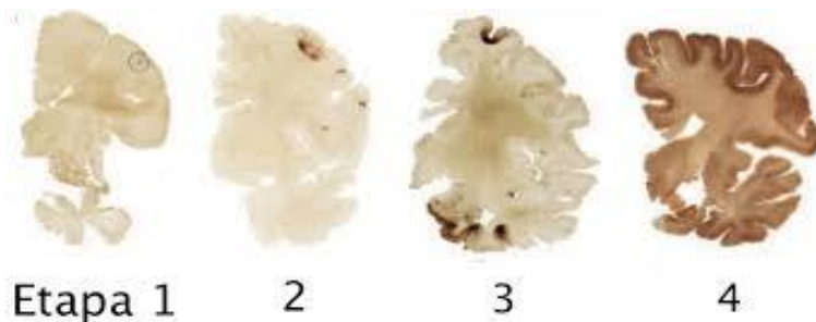
Fig. 3 representación histológica del daño progresivo por las etapas nombradas.

En etapa IV , se produce una pérdida de mielina, astrocitosis de la sustancia blanca y la pérdida neuronal en la corteza cerebral, hipocampo y sustancia negra. Los depósitos de P-tau se encuentran por todo el cerebro, tronco cerebral, cerebelo y en algunos casos incluso en medula espinal. Los depósitos de TDP-43 se encuentran dispersos de forma generalizada, esta es una proteína de regulación del metabolismo del ARN, cuya desregulación sería la base de las taupatías, siendo causantes de la hiperfosforilación, resistencia fosfatasa tau y depósitos intracelulares de Tau. 78