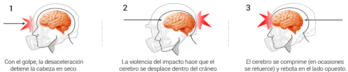
Fig. 1 fenómeno de impacto y contragolpe.

que actúan como mediadores de las cascadas enzimáticas que se desencadena durante los fenómenos de inflamación y reparación. Sin embargo, si el estímulo se mantiene activo en él, daría lugar a un proceso de inmunotoxicidad y una alteración en la membrana de la axolema, así como en la estructura de los microtúbulos que componen los axones y las neuronas, permitiendo el depósito de proteína tau, la cual parece ser la principal responsable del deterioro neuronal. Los primeros estudios sobre la biofísica del trauma craneal y la conmoción, realizados sobre primates, llegaron a la conclusión de que el fenómeno de conmoción cerebral era producido fundamentalmente por aceleración rotacional y fuerzas de cizallamiento, siendo menos importante para ello el fenómeno de impacto y contragolpe. 65